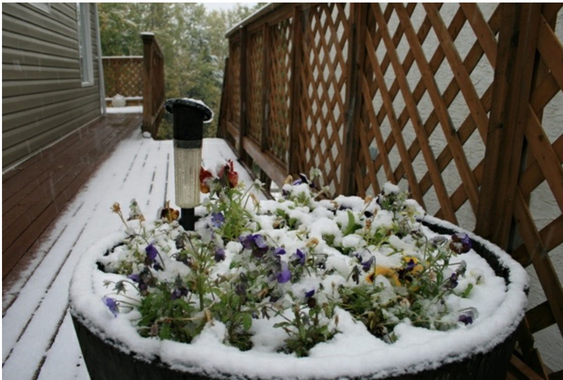
Arme blommetjes ...

Tja, daar gaan we weer. Niet zeuren, dit is Alberta. Geen Global warming lijkt me zo.